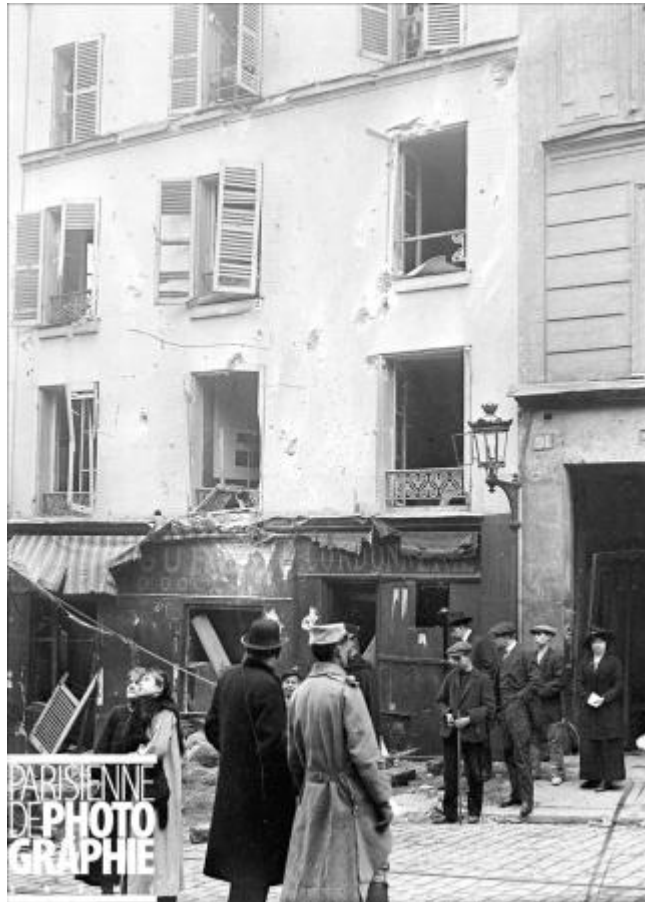
Guerre 1914-1918. Bombardement de Paris par un zeppelin. Maison criblée d'éclats, 89-91 rue de Ménilmontant (XXème arrondissement). 20 janvier 1916.