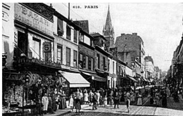
rue de ménilmontant

La maison de la laïcité de Paris va ouvrir à l'intersection de la rue de Ménilmontant et de la rue des Pyrénées, dans les locaux du pavillon Carré de Baudouin, un hôtel particulier rouvert au public le 21 juin 2007, comme lieu dédié à la Culture et à la création.