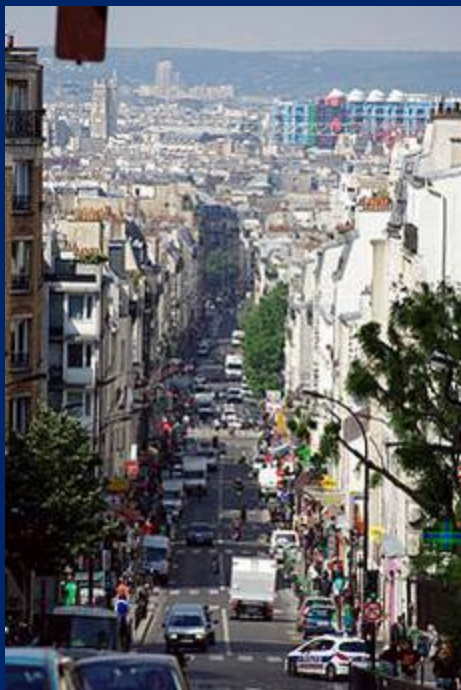
vue de la rue

Images et documents sur Wikimedia Commons